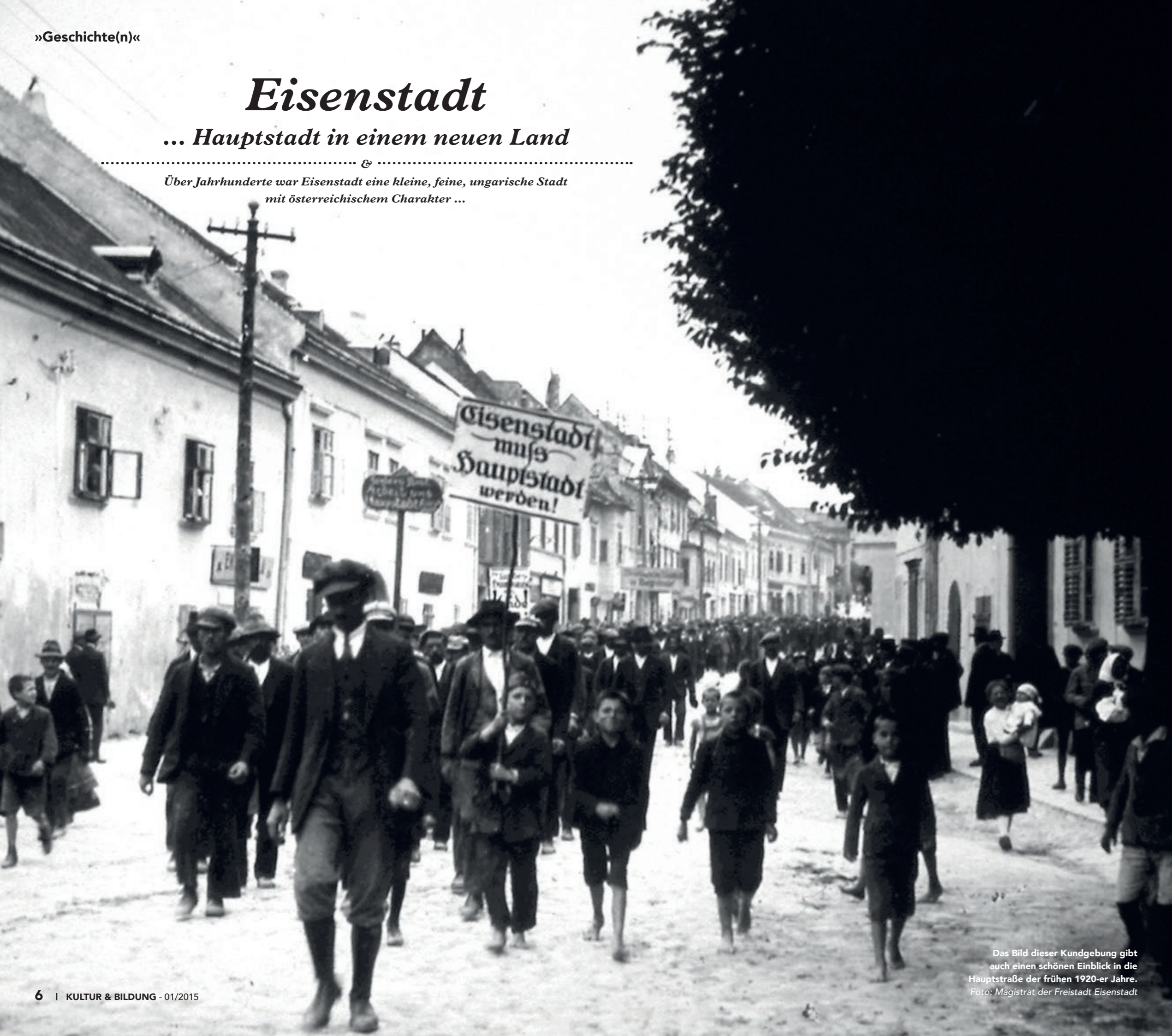
Das Bild dieser Kundgebung gibt auch einen schönen Einblick in die Hauptstraße der frühen 1920-er Jahre.