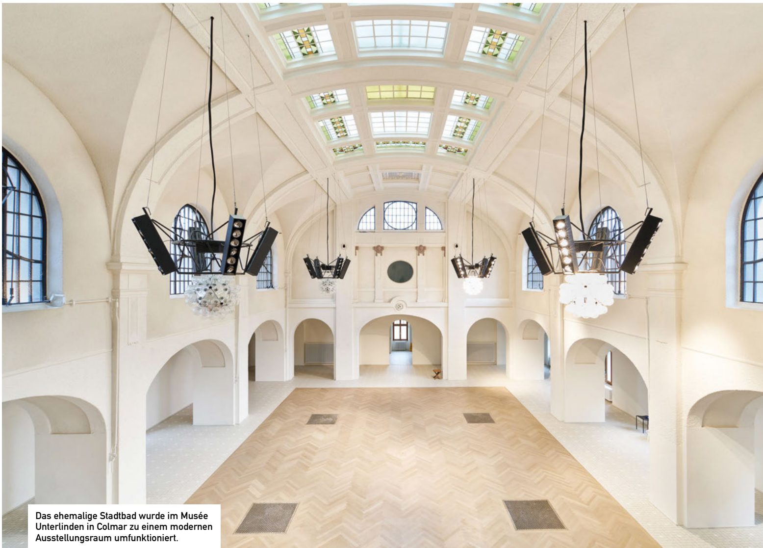
Das ehemalige Stadtbad wurde im Musée Unterlinden in Colmar zu einem modernen Ausstellungsraum umfunktioniert.